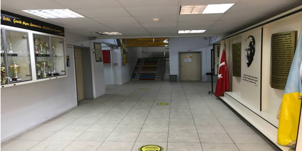
BİNA GİRİŞ İÇ KISIM