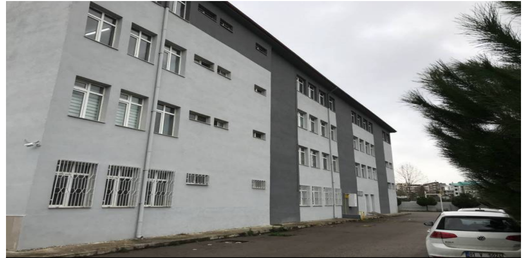
BİNA ARKA CEPHE