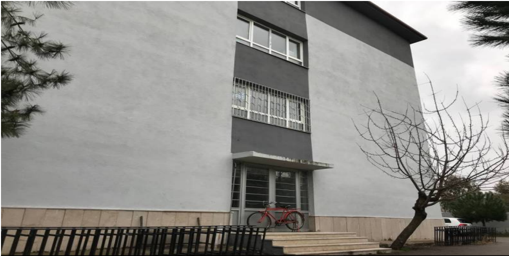
BİNA YAN CEPHE-2