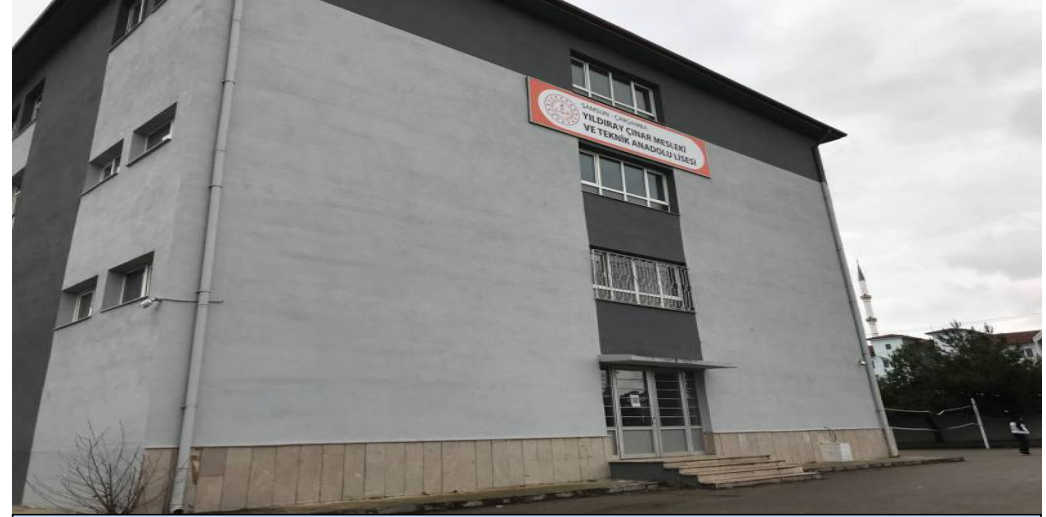
BİNA YAN CEPHE-1