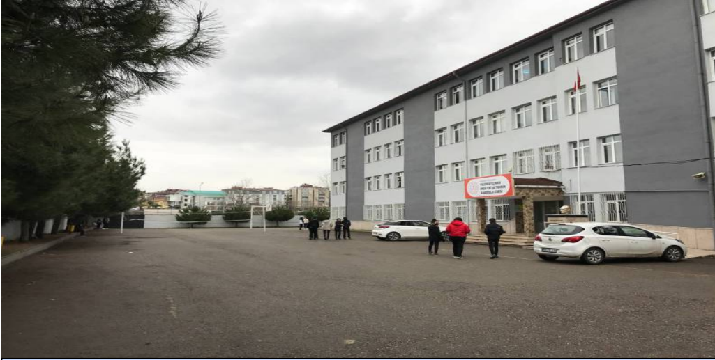
BİNA ÖN CEPHE