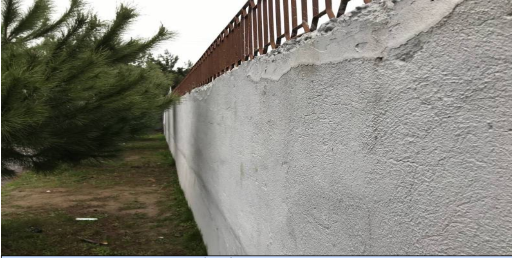
BİNA İHATA DUVARI