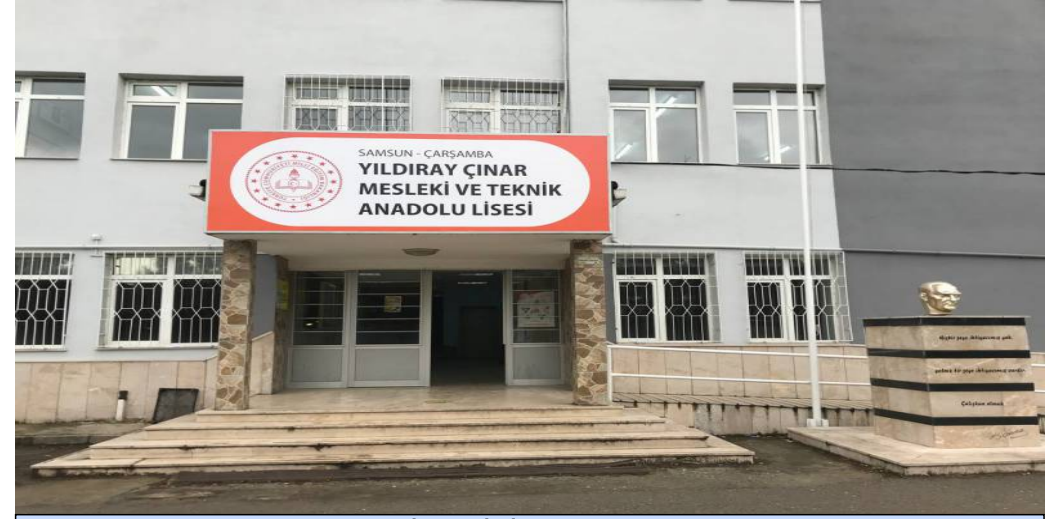
BİNA GİRİŞ DİŞ KISIM